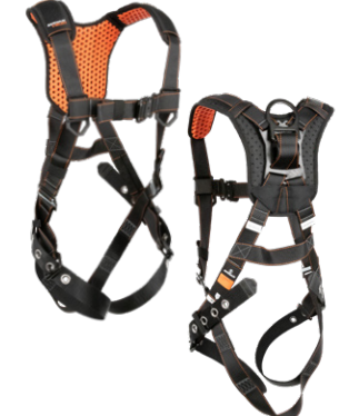
8 1D, QC Chest, TB Legs