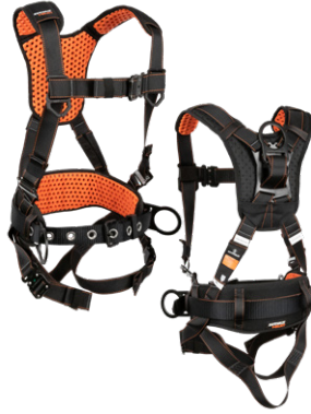
2 3D, QC Chest/Legs