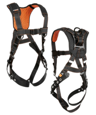
9 1D, MB Chest, TB Legs