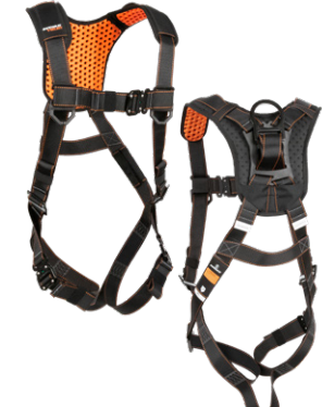
7 1D, QC Chest/Legs