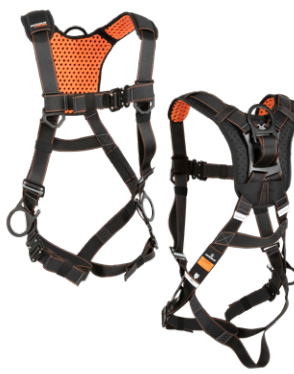
6 3D, QC Chest/Legs