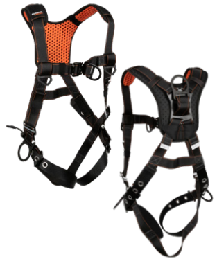
5 3D, QC Chest, FD, TB Legs