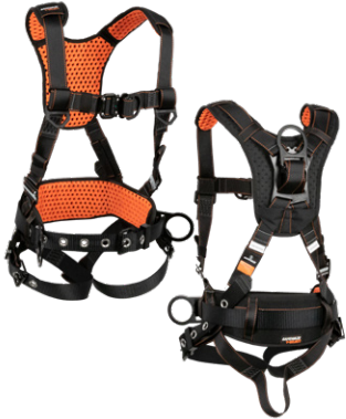
1 3D, QC Chest, FD, TB Legs