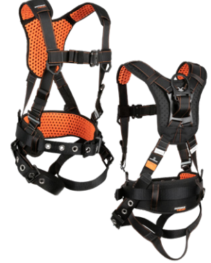
4 1D, QC Chest, TB Legs