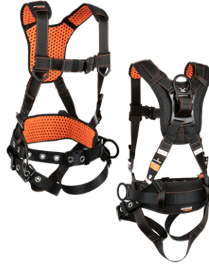
3 3D, QC Chest, TB Legs